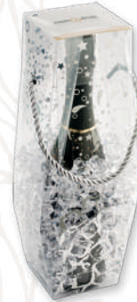
ART. 65 Bag&Glaccette (bottle 0,75 lt.)