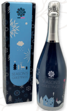
ART. 85 Single printed box (bottle 0,75 lt.)