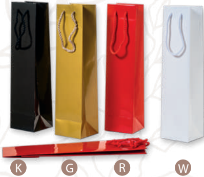
ART. 69 Paper shopper (bottle 0,75 lt.)