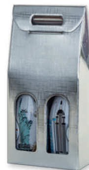
ART. 96 Silver effect (2 bottles 0,75 lt.)