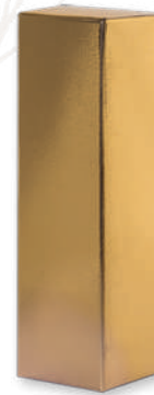
ART. 84 Gold effect (bottle 0,75 lt.)