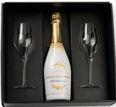
ART. 28 Prestige (bottle 0,75 lt.)