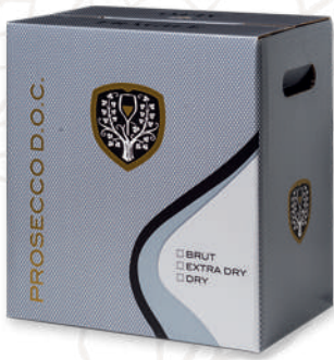
Standard Box 6 bottles (0,75 lt.)