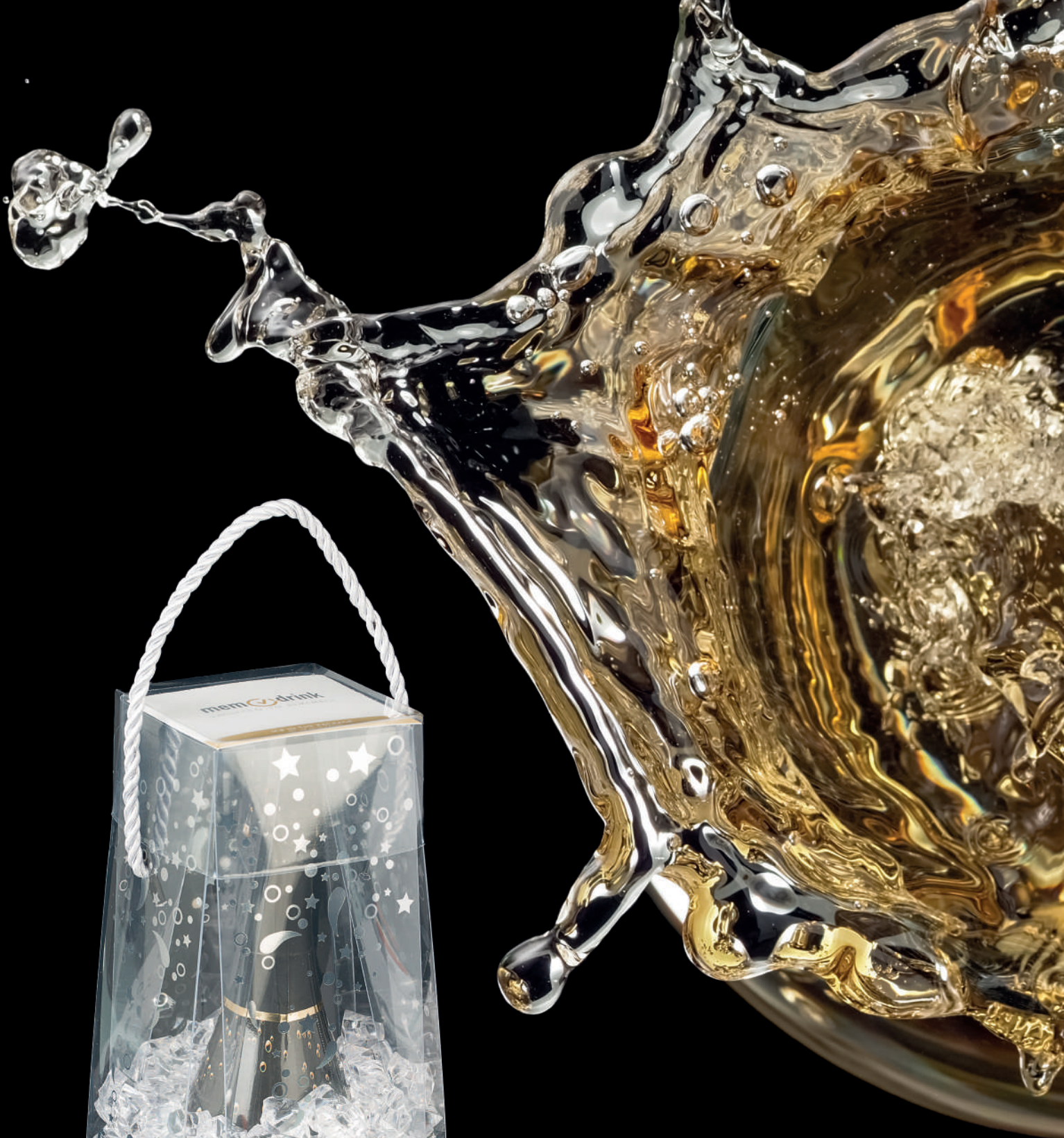
● Bag&Glacette art. 65 (bottle 0,75 lt)