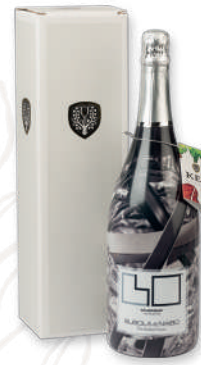
Standard Box Magnum (1,5 lt.)